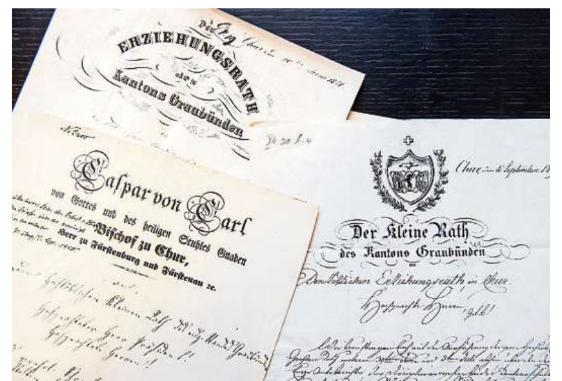
Hitziger Schriftenwechsel: Links der Brief des Bischofs an den kantonalen Erziehungsrat, rechts die Antwort des «Kleinen Rath».